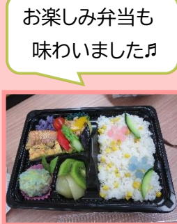
お楽しみ弁当も 味わいました♪