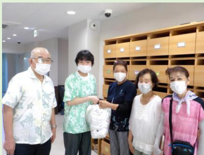
沢山の雑巾を届けて頂きました。