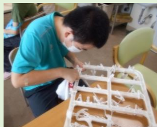
いつも清掃の際に 使わせてもらっています。