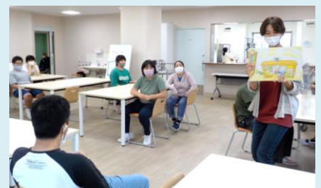
紙芝居を聞いて 防災について学びました。