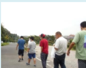
地域の避難場所を 確認しに行きました。

9/1（水）は『防災の日』ということで、「地域の避難場所確認」、「防災食作り」、「非常食を食べる」、「防災の紙芝居」など防災に関することに色々取り組みました。