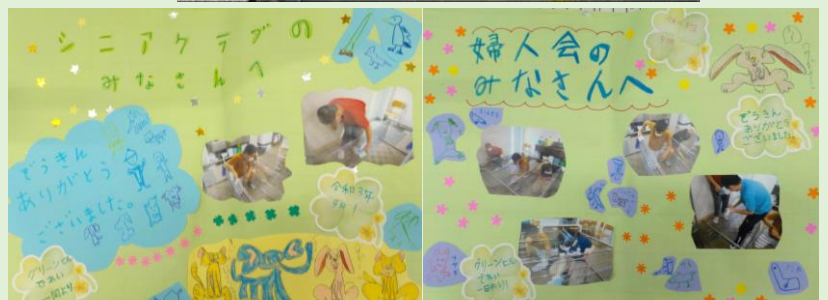
お礼をお伝えに行きました。