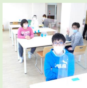
テーブルの間にはアクリル板を設置して飛沫対策もしています。