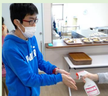
来所時、活動時、昼食時などにアルコール消毒をしています。

利用者の皆さんも感染対策を意識しながら手洗い、消毒、マスク着用、距離を保つことなどに取り組んでいます。