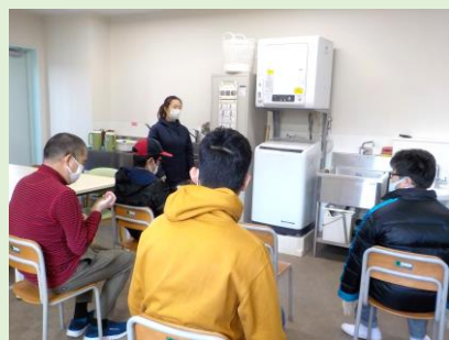
各活動場でも距離を保って座る、離れて活動するなどしています。