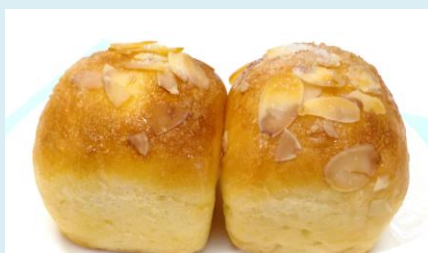
シュガーアーモンドパン ¥100 (2個入り)