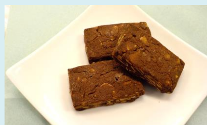
アーモンドココアクッキー ¥100 (3個入り)