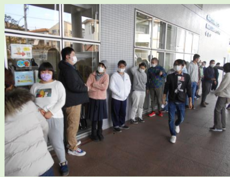
3回目のワクチン接種を行いました。並んで落ち着いて接種できました。